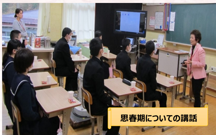
思春期についての講話